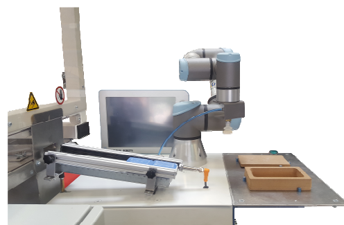
Implantation de UR3 dans la ligne PRODUCTICC, en aval de la presse à savonnettes.